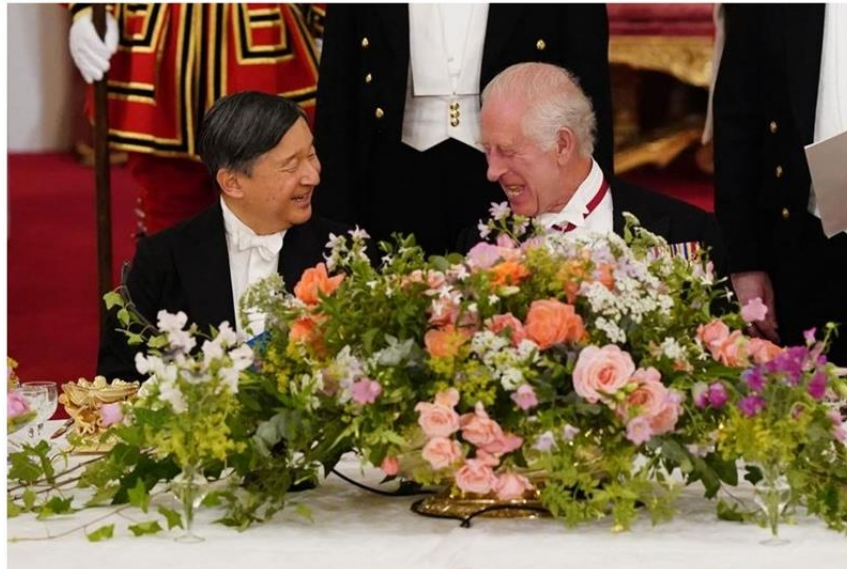
国賓晩餐会で笑いを交わす天皇陛下と国王陛下（2024年6月25日、バッキンガム宮殿）。

両陛下はその後、馬車でバッキンガム宮殿に移動され、両陛下を讃える晩餐会が開催された。国王と天皇はともにスピーチを行い、国王はポケモンやハローキティといった軽快な大衆文化に言及し、天皇は両国が"真の相互理解"に努めることの重要性を強調した。