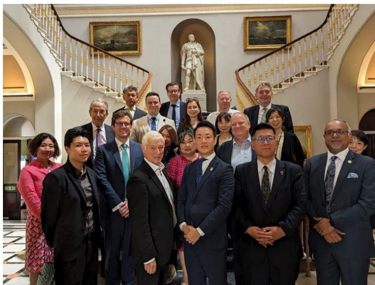
ジェームズ・ヘラーUK ジャパン・コネクット会長（前列左から 3 人目）と横山秀之大阪市長（前列右から 3 人目）一行（2024 年 6 月 27 日、IOD 本部 116 ポール・モールにて）。

この円卓会議は 4 月に日本大使館で開催されたインスティテュート・オブ・ディレクターズ主催のイベントに続くもので、同じく 2025 年万博に焦点を当て、UK ジャパン・コネクット運営委員会の佐々木智子氏とジャック・ホロビン氏が出席した。ビジネス・投資機会シンポジウム」では、林肇駐英大使、グレッグ・クラーク英国首相特命全権大使（当時）、オフォード英国輸出大臣（当時）の講演が行われた。このイベントでは、多くの日本企業が紹介され、参加者は日本企業と交流する機会を得た。