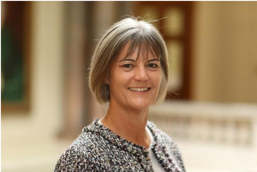
Julia Longbottom CMG, British Ambassador to Japan.

The Government is also committed to ensuring that AUKUS, the trilateral security partnership with Australia and the United States, delivers its full potential. AUKUS pillar 2 provides opportunities to develop advanced capabilities, including cyber, artificial intelligence and hypersonic, working with other like-minded nations - and Japan is on that list.