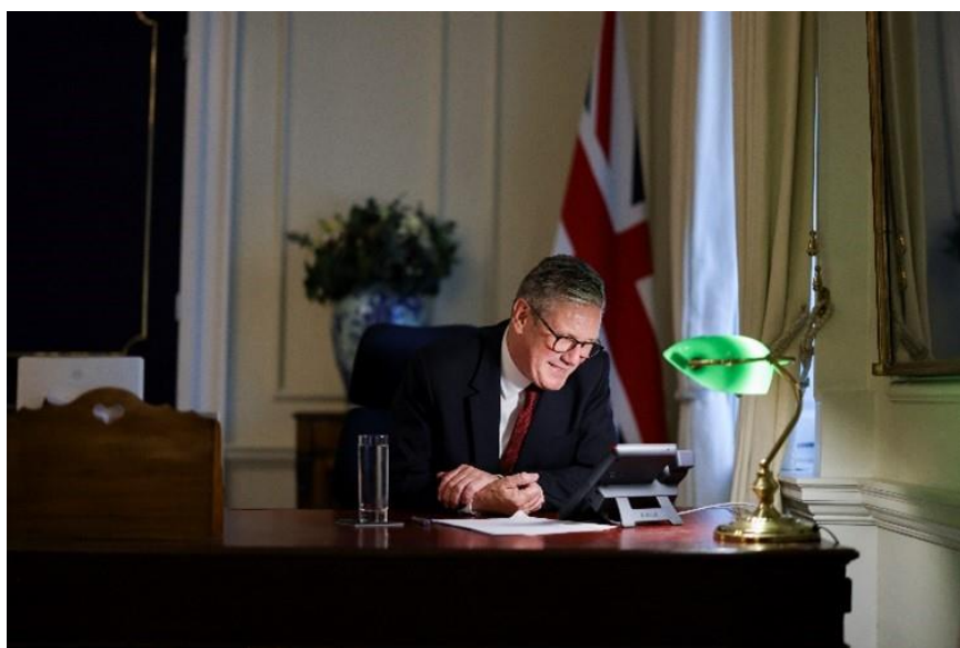
就任 2 日目（2024 年 7 月 6 日）、岸田文雄首相に電話したキア・スターマー新首相。

日英関係はかつてないほど緊密で強固なものとなっており、それは 6 月の天皇皇后両陛下のご訪問が最もよく示している。この緊密な関係を認識し、キア・スターマー首相は選挙結果の翌日（7 月 6 日）、岸田首相と早々に会談を行った。会談では、ユーロ大西洋とインド太平洋の安全保障の不可分性、G7、グローバルな問題、ウクライナ情勢、中東情勢、東アジア情勢を含む地域情勢など、広範な問題が話し合われた。さらに 7 月 17 日には、デービッド・ラミー外務大臣が日本の上川外務大臣と入門的な電話会談を行い、今後数週間から数ヶ月間、様々な問題に関して緊密な協力を継続することに合意した。両外相は、価値観と原則を共有する日英間のパートナーシップがかつてないほど緊密で強固なものであることで一致し、二国間関係をさらに強化し、法の支配に基づく自由で開かれた国際秩序を維持・強化する意向を伝えた。両大臣は、包括的及び先進的な環太平洋パートナーシップ（CPTPP）のような重要な経済・通商ファイルに関する我々の協調を継続する必要性を確認した