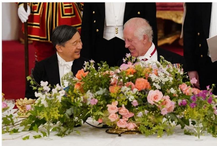
HM The Emperor and HM The King share a laugh at the State Banquet, Buckingham Palace, 25 June 2024

Their Majesties then travelled to Buckingham Palace by carriage where a State Banquet was held in their honour. The King and the Emperor both made speeches, including light-hearted popular culture references to Pokémon and Hello Kitty from the King and an emphasis from the Emperor on the importance of the two countries striving for "true mutual understanding."