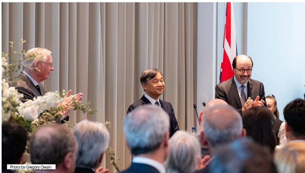
天皇陛下（中央）、グロスター公爵（左）、ジャパン・ソサエティーのビル・エモット委員長（右）、2024年6月24日、ロンドン・ヒルトン・パークレーンでの日系コミュニティ&フレンズとのレセプションにて。

その週の初め、天皇陛下はジャパン・ソサエティー主催のレセプションに出席され、文化・市民社会、企業、科学・研究界から選ばれた来賓、皇室、王室、両政府の代表者らとご一緒された。