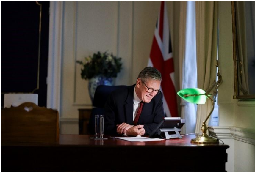
New UK Prime Minister Keir Starmer called Japan Prime Minister Fumio Kishida on his second day in office (6 July 2024).